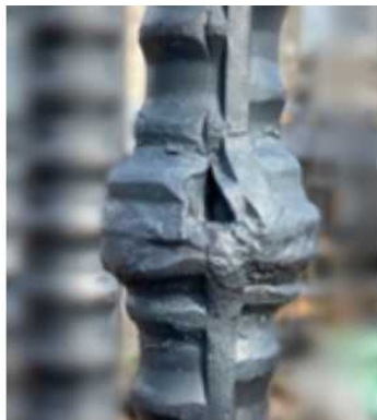
外観不良 (へこみ、切り欠き)